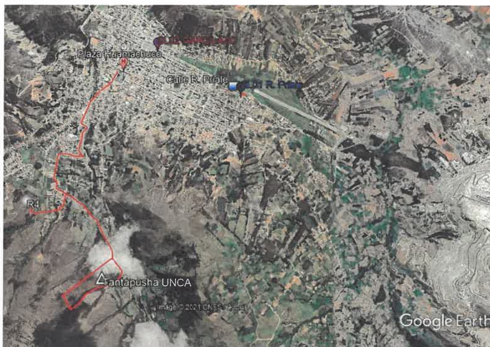
Imagen 04: Ruta de acceso a Tantapusha