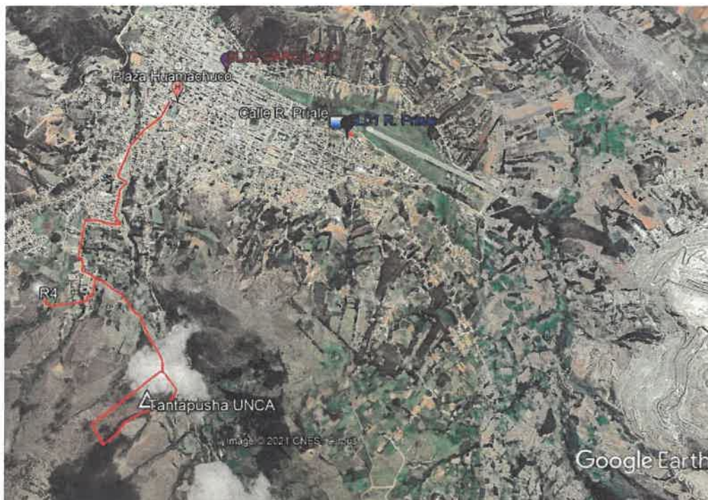
Imagen 04: Ruta de acceso a Tantapusha