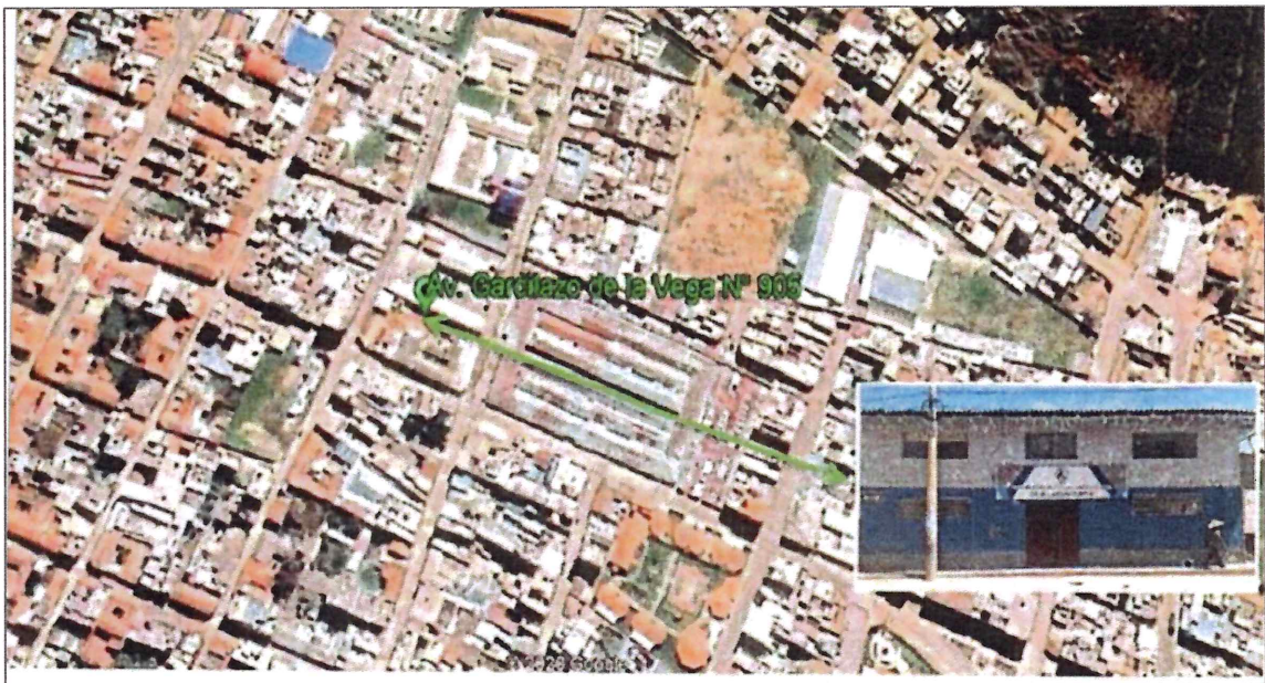
UBICACIÓN DE LA SEDE LABORATORIOS (Av. Garcilaso de la Vega N° 905 UTM: 9135297; E 825932).