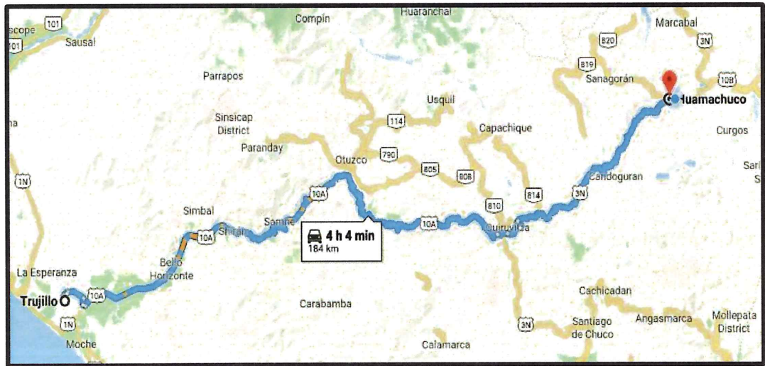
Croquis de acceso a la zona

Tomando como referencia Ciudad de Trujillo, se tiene: