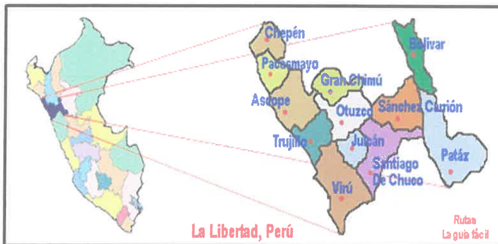
PAÍS PERÚ: Región La Libertad