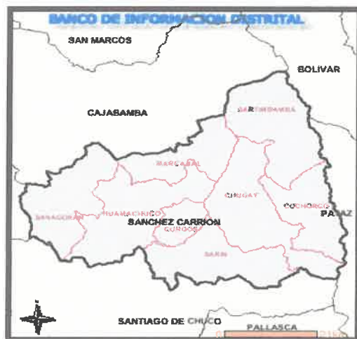
Distrito de Huamachuco